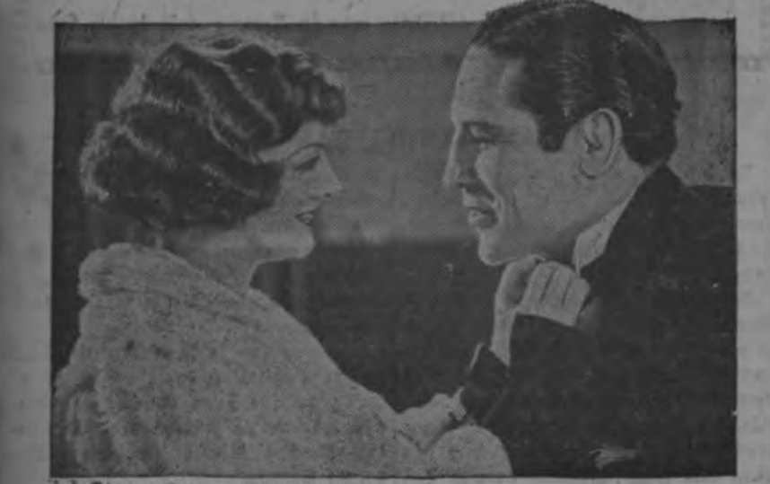
MYRNA LOY and MAX BAER in "THE PRIZEFIGHTER AND THE LADY"

Retire su localidad con tiempo ahora mismo si puede, porque desde anoche ya casi no hay localidades para el estrenazo de "Volando Hacia Río Janeiro".