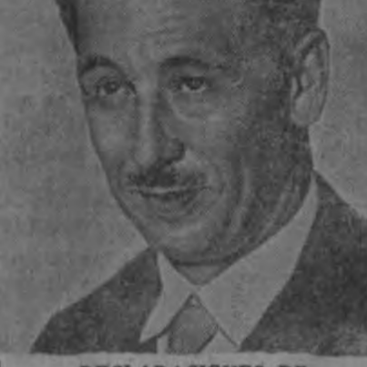
DECLARACIONES DE COMPANYS

BARCELONA, 14. — Hablando con los corresponsales de la prensa extranjera, Companys indicó la posibilidad de la emancipación de Cataluña en el caso de que Madrid declare la ley marcial. Companys fué interrogado sobre el hecho de si es o no cierto el rumor circular de que Cataluña está preparada para declarar su secesión, a lo cual, con toda energía, dijo: "Yo no niego nada", y antes de que fuera terminada la pregunta de sus interlocutores sobre si el rumor es toda una realidad, añadió: "Y por qué iba yo a negar eso?"