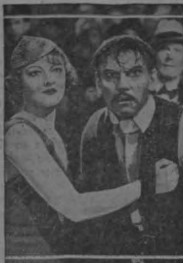
MYRNA LOY and WALTER HUSTON in "THE PRIZEFIGHTER AND THE LADY"